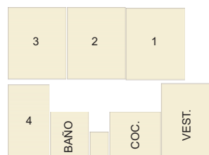
Esquema de distribución de vivienda A