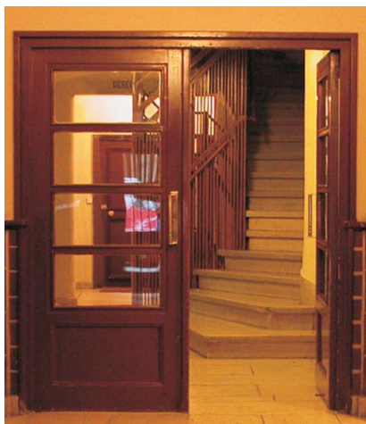
Portal de Gaztambide 17. MMN Arquitectos Nov. 2003