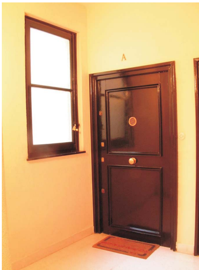
Puerta en Meléndez Valdés 61.

No se deben sustituir por otro material o diseño. En el caso de ser necesario el blindaje, habrá de ser realizado sin variar en ningún caso el aspecto de las puertas (incluir internamente).