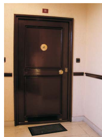
Puerta en Gaztambide 21.