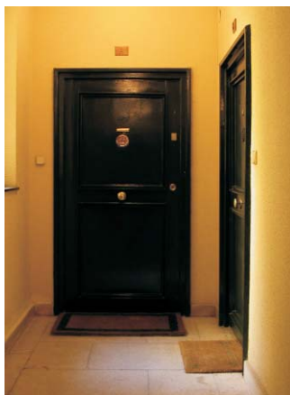
Puerta en Rodríguez San Pedro 70.